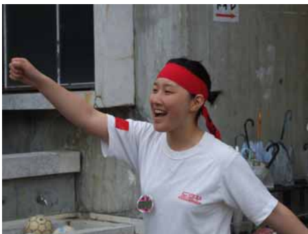
やったー！紅軍(赤組)イギョラ！