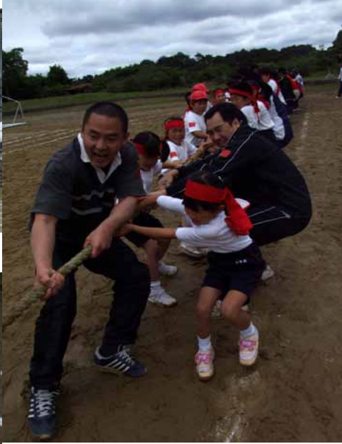
トンポと学生がひとつになって！！