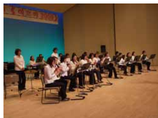
オモニ器楽演奏オンヘヤ