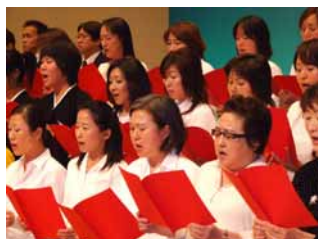
女盟オモニのパワーは凄い