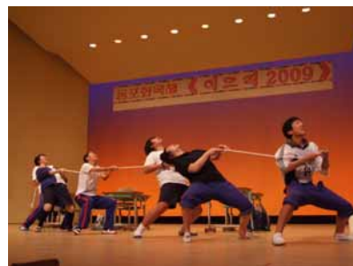
中央口演大会でも金賞を受賞した中級部の演劇「タギョウ」(綱引き)