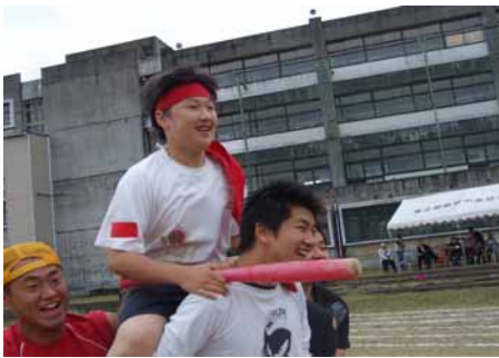
この勝負いただき！！